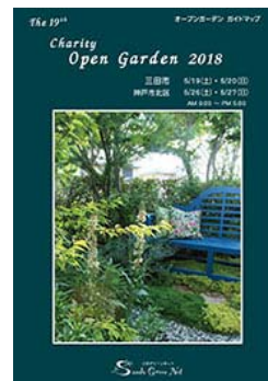
オープンガーデン ガイドマップ